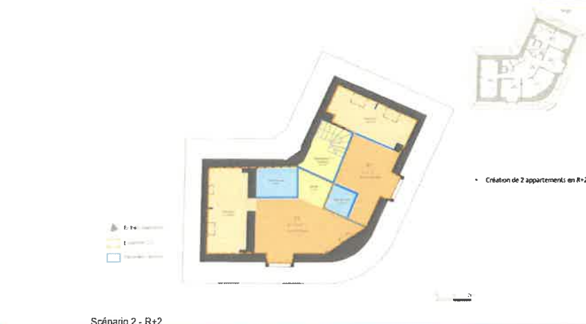
Scénario 2 - R+2