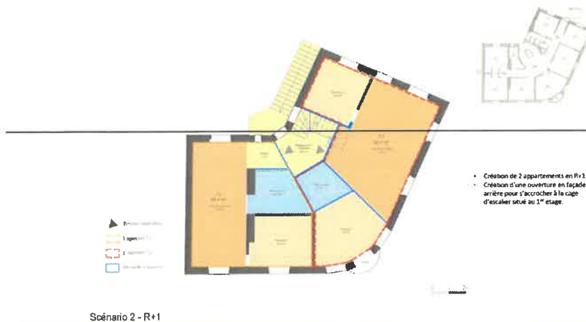
Scénario 2 - R+1